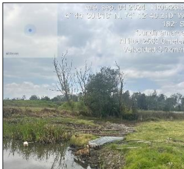
Ilustración 6. Manguera en la ronda del humedal

C.P.250020 Tel. +57(1) 823 40 70 823 40 71 / 823 40 73 Fax. + 57(1) 825 76 20 Dir. Cra. 14 No. 13-05