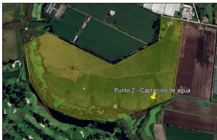
Ilustración 2. Ubicación del predio

Dentro del recorrido de control y vigilancia se evidenció una captación de agua superficial en el Humedal Gualí, en el predio denominado “La Mitaca” (Ilustración 2. polígono amarillo) coordenadas 4°44'25.241" N, 74°12'38.694" W, como se muestra en la ilustración 3.