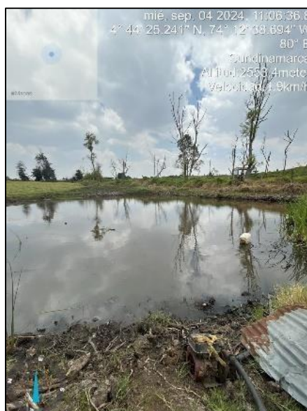
Ilustración 3. Motobomba en la ronda del Humedal