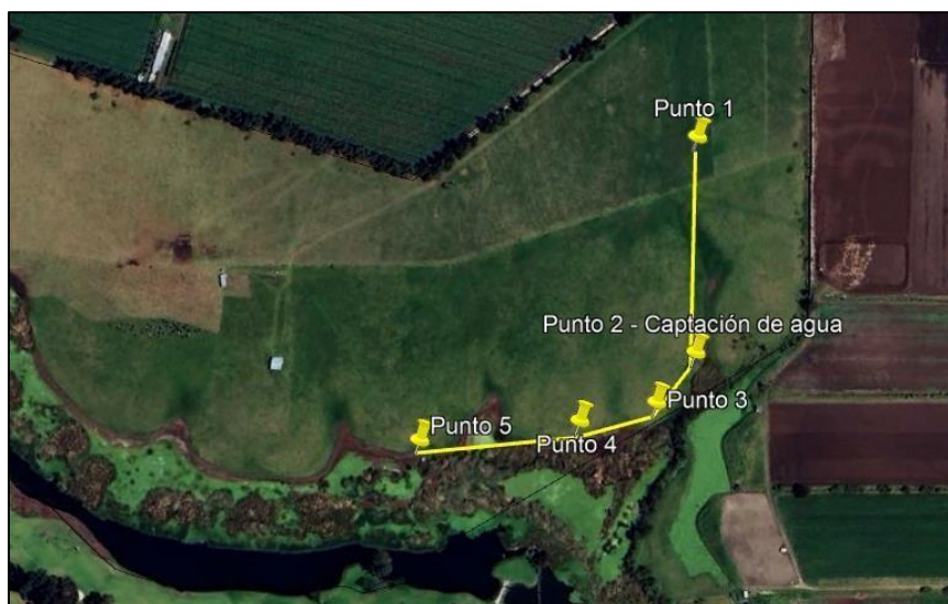
Ilustración 1. Recorrido de control y vigilancia ronda Humedal Gualí

Con base en lo anterior, el día 04 de septiembre se realizó recorrido de control y vigilancia en el humedal Gualí desde las coordenadas 4°44'30.818" N, 74°12'40.210" W hasta las coordenadas 4°44'21.033" N, 74°12'45.237" W (ver ilustración 1. Ruta amarilla) vereda El Cacique, ecosistema que fue declarado por la Corporación Autónoma Regional de Cundinamarca - CAR como Distrito Regional de Manejo Integrado a través del acuerdo 001 de 2014 "Por medio del cual se declaran como Distrito Regional de Manejo Integrado (DMI), los terrenos comprendidos por los humedales de Gualí, Tres Esquinas y Lagunas de Funzhé, y su área de influencia directa ubicada en los municipios de Funza, Mosquera y Tenjo, Cundinamarca", y estableció tres zonas: 1. Preservación (espejo de agua), 2. Recuperación (50 metros) y 3. Uso sostenible (100 metros).