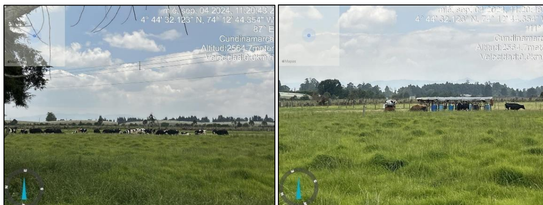
Ilustración 5. Actividad pecuaria

En el predio se realizan actividades pecuarias, como se observa en las siguientes ilustraciones: